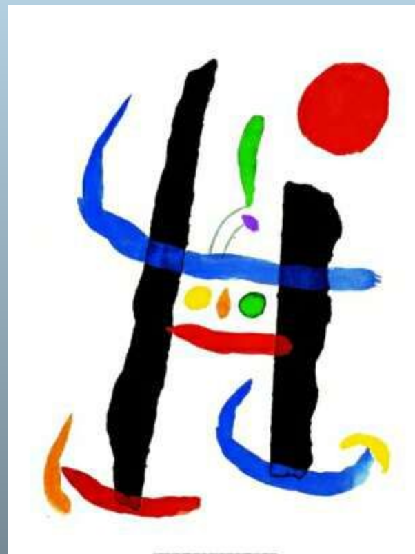
"При любом испытании"