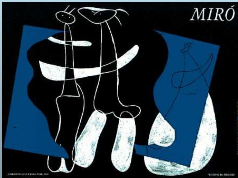
"3 персонажа любящие ночь"