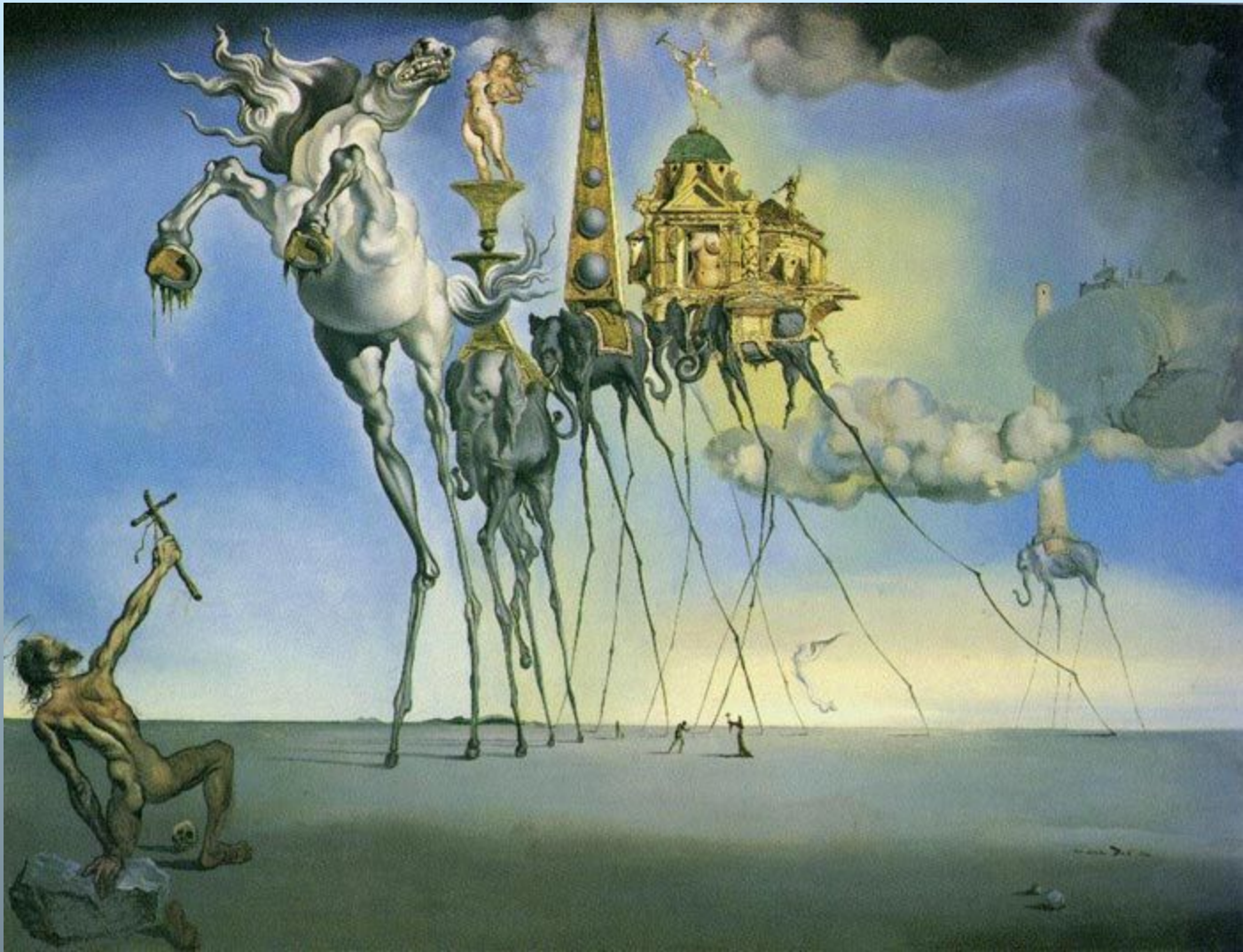
"Искушение Святого Антония" 1946 г.