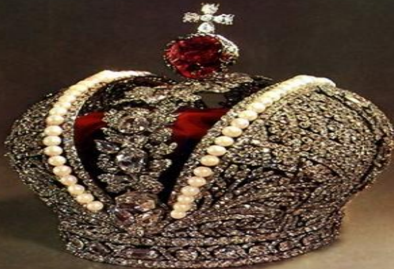
Корона Российской империи