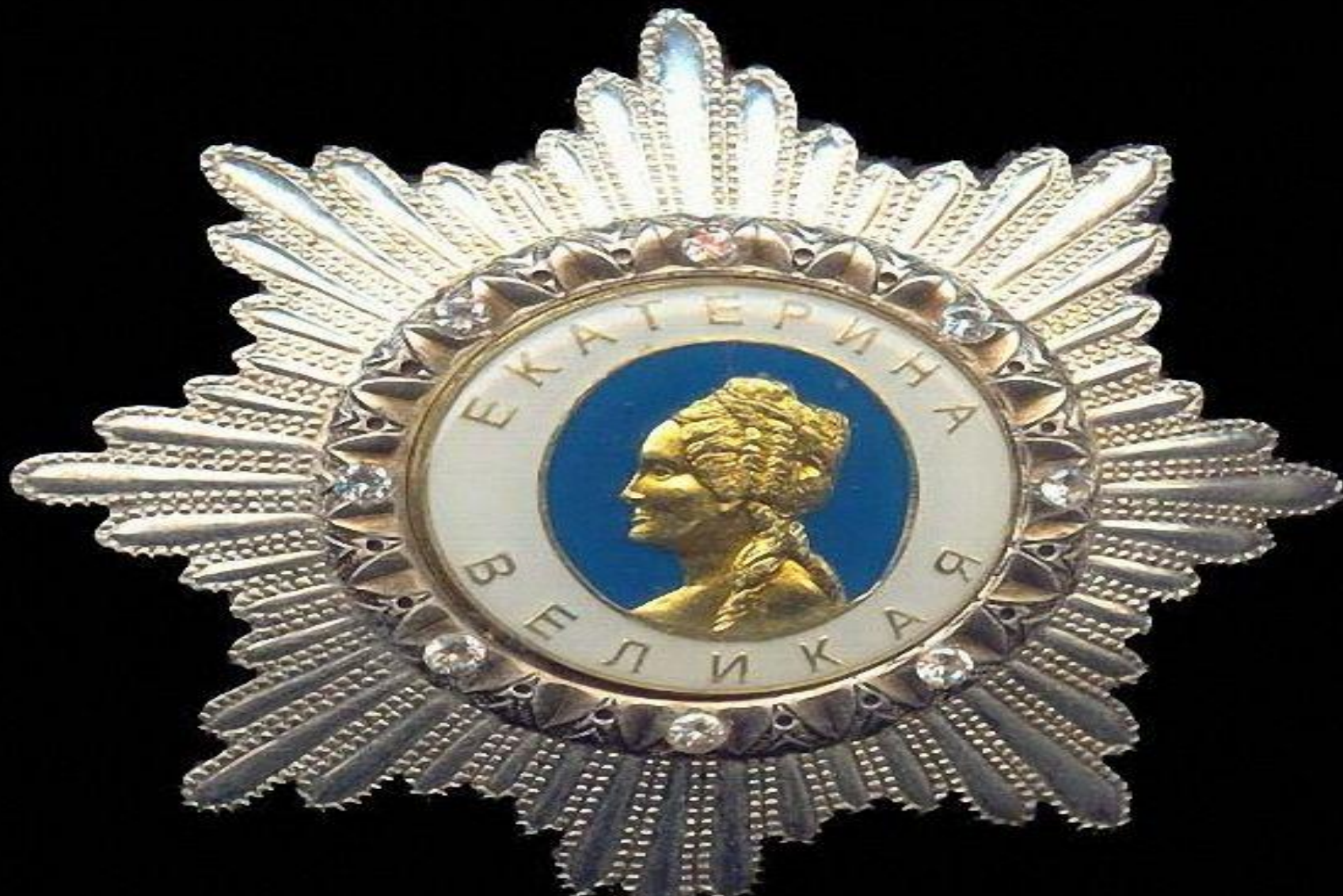
Орден Екатерины Великой