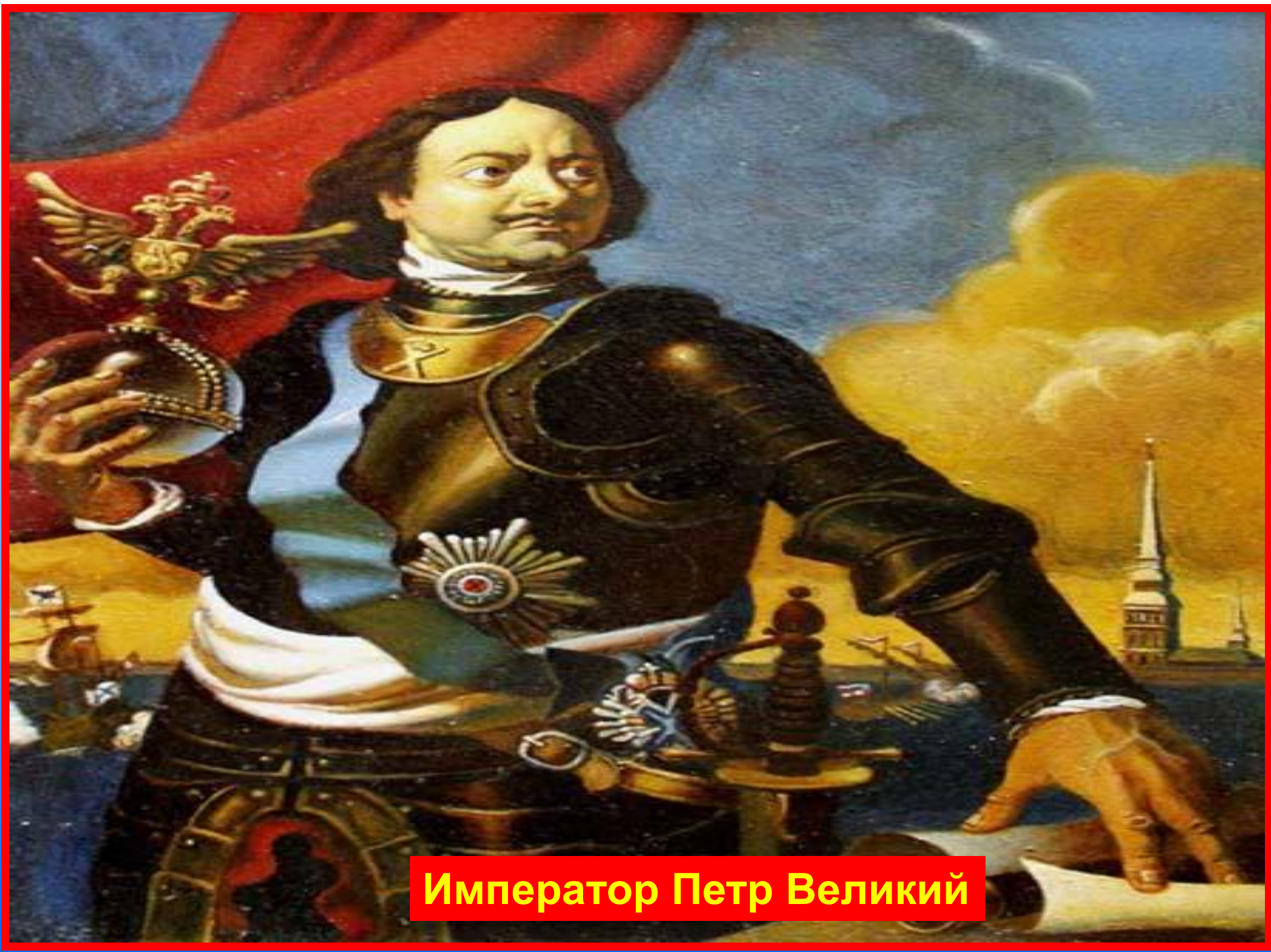
Император Петр Великий