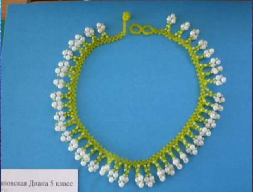
Новоская Диана 5 класс