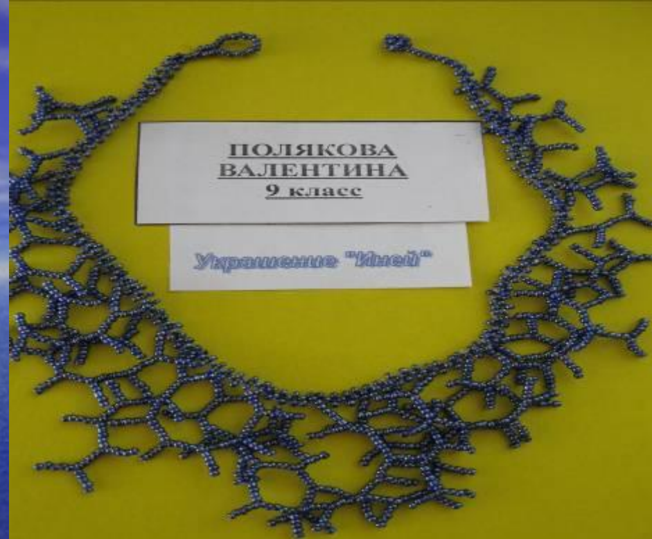
ПОЛЯКОВА ВАЛЕНТИНА 9 класс