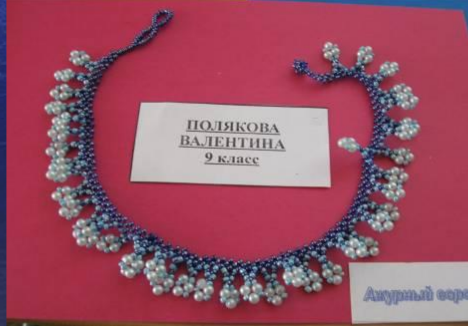
ПОЛЯКОВА ВАЛЕНТИНА 9 класс