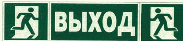
Конечный эвакуационный выход

(при наличии двух направляющих линий в коридорах шириной более 2 м и помещениях большой площади) 1)