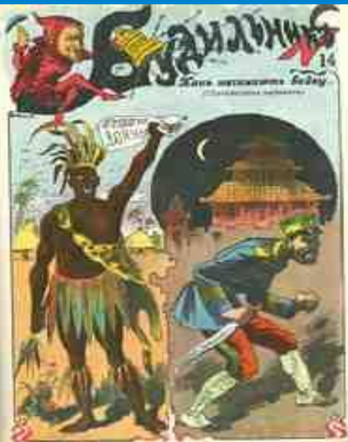
Два человека разные...