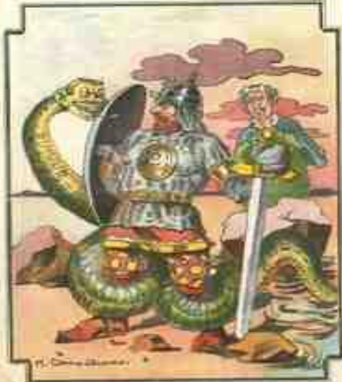
Illustration 1911: A political cartoon depicting a large, armored figure with a snake for a head, standing on a globe, and a man in a suit holding a sword.