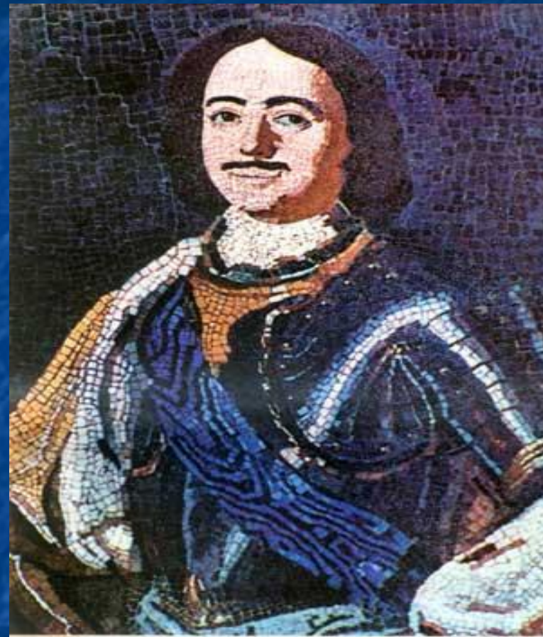
Мозаика «Пётр 1»