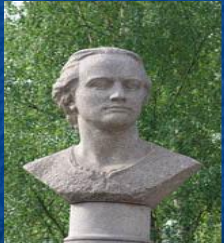
Памятник Ломоносову в г. Архангельске у ПГУ им М.В.Ломоносова