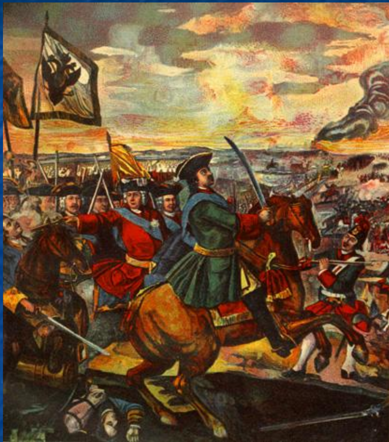
Мозаика «Полтавская битва»