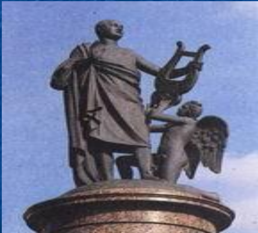
Памятник Ломоносову в г. Архангельске