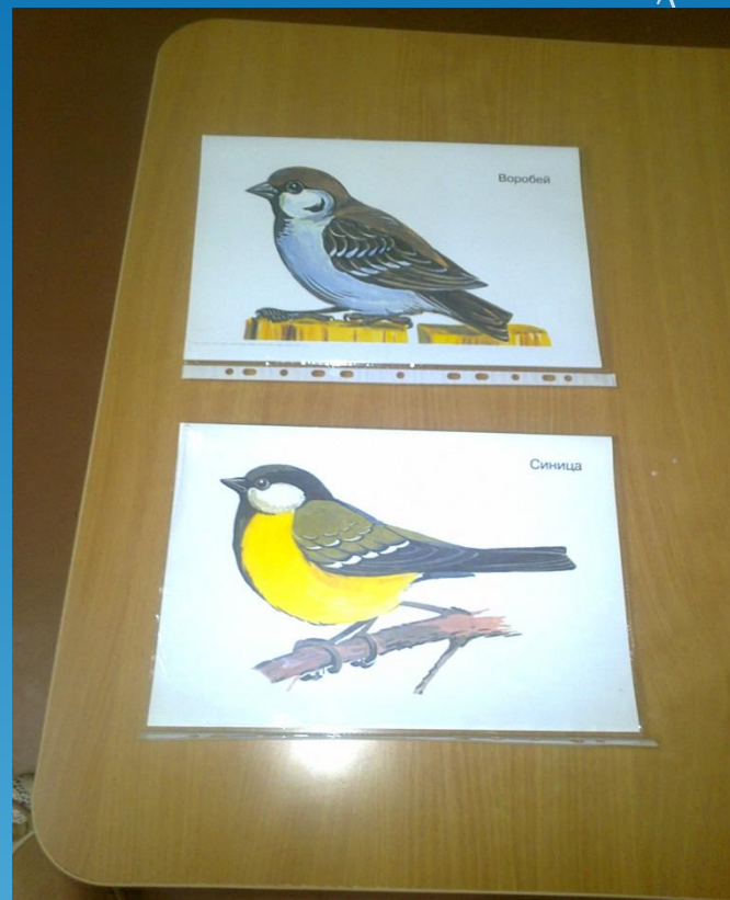
Демонстрационный материал «Зимующие птицы»