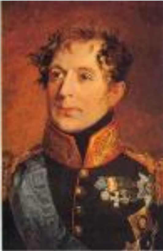
Михаил Андреевич Милорадович

Герой Отечественной войны 1812 года Генерал-губернатор Санкт-Петербурга Михаил Милорадович появился верхом перед солдатами, построившимися в каре. П. Каховский выстрелил в генерал- губернатора.