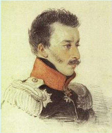
Сергей Григорьевич Волконский