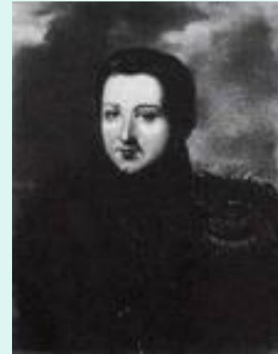
Михаил Павлович Бестужев-Рюмин

Радикальные, революционные взгляды. Основные положения программы: