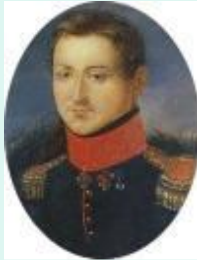
Сергей Иванович Муравьев-Апостол