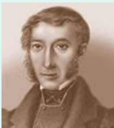
Сергей Петрович Трубецкой