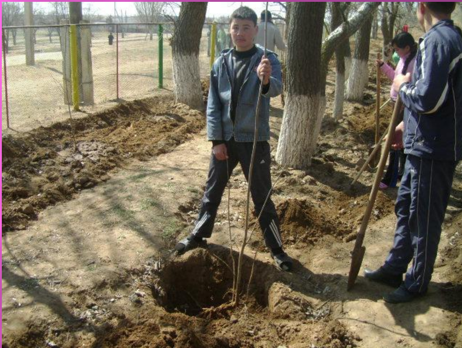
Акция «Посади дерево»