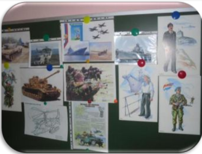
Тема: «Папин праздник»