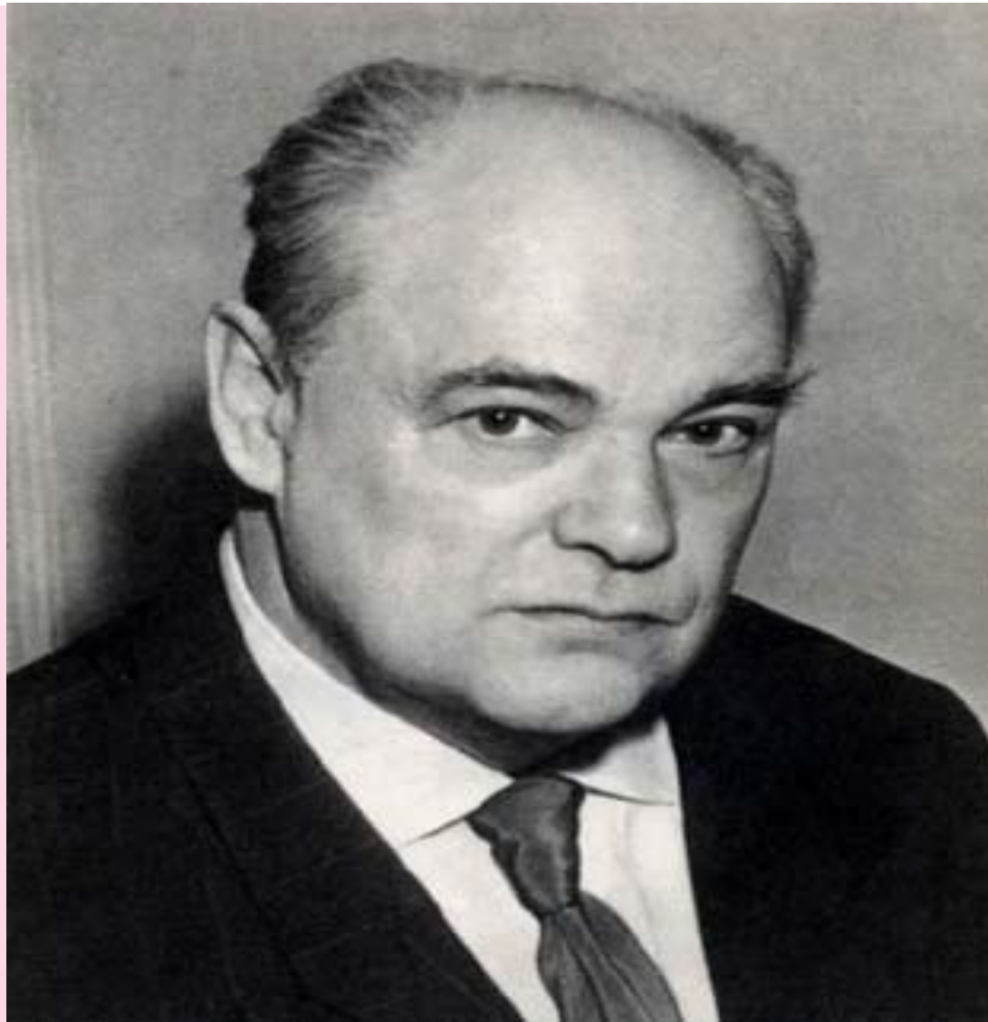
Евгений Иванович Чарушин (1901г. -1965г.)