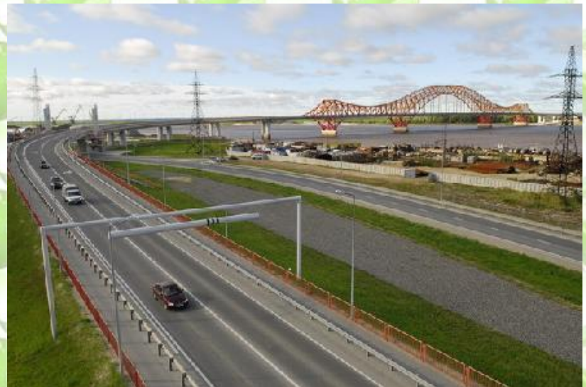
Мост через реку Иртыш