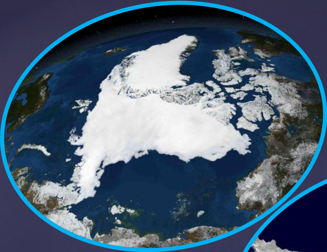
Арктика. Северный полюс