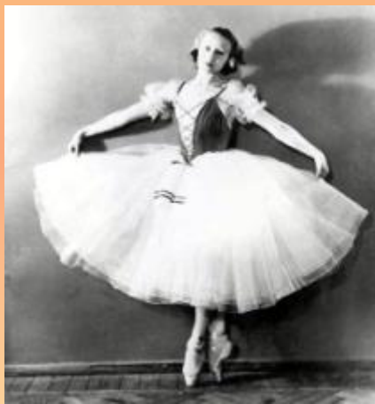
Легенда русского и советского балета. ... Галина Сергеевна Уланова родилась в Санкт-Петербурге 08 января 1910 ...