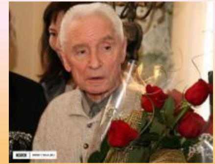
Выдающийся балетмейстер Юрий Григорович 1.01 1927