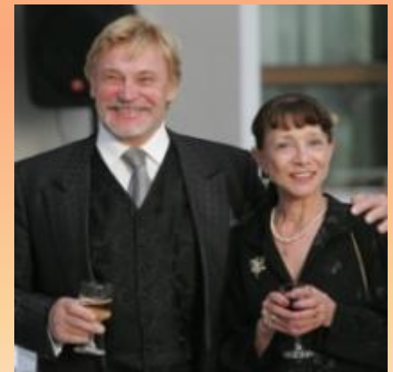
«Золотая пара балета XX века» - Владимир Васильев и Екатерина Максимова