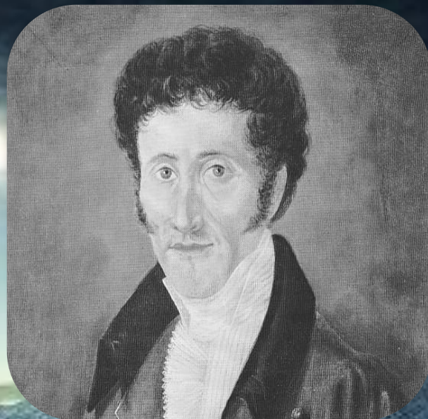
Эрнст Теодор Амадей Гофман писатель.