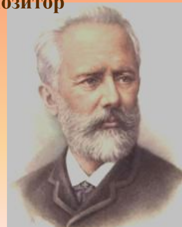
П. И. Чайковский Композитор