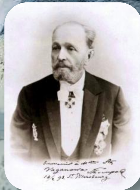
Мариус Петип хореограф

Какой вид искусства получится при союзе этих профессий?