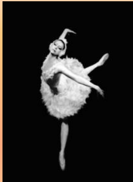
Народная артистка СССР Майя ПЛИСЕЦКАЯ. .