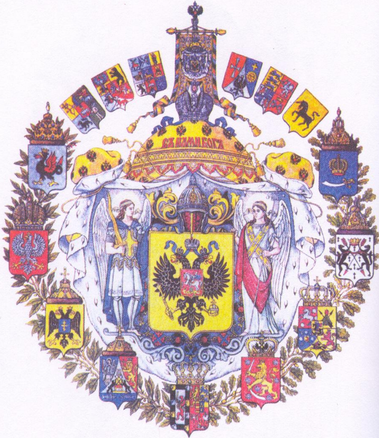
13. Большой государственный герб Российской империи 1882 г.