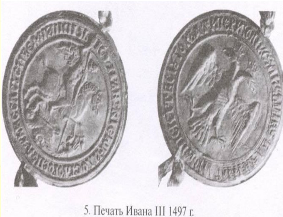
5. Печать Ивана III 1497 г.