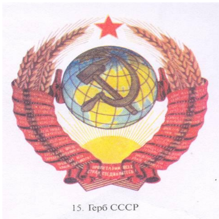
15. Герб СССР