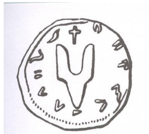
Печать князя Святослава Игоревича