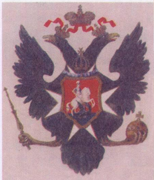
11. Герб 1799 г.