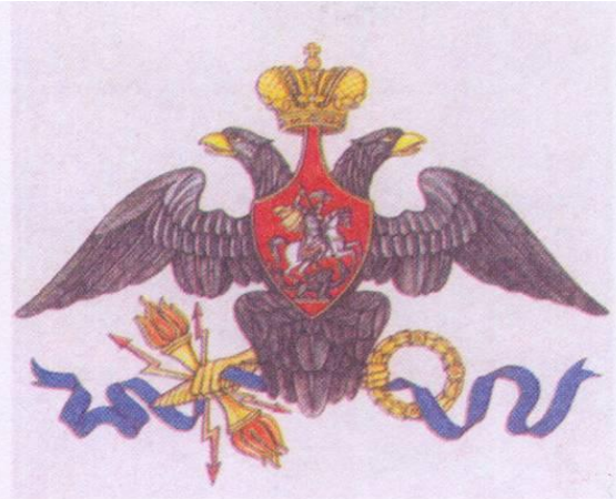
12. Вариант герба первой половины XIX в.