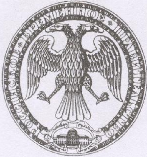
Печать Временного правительства