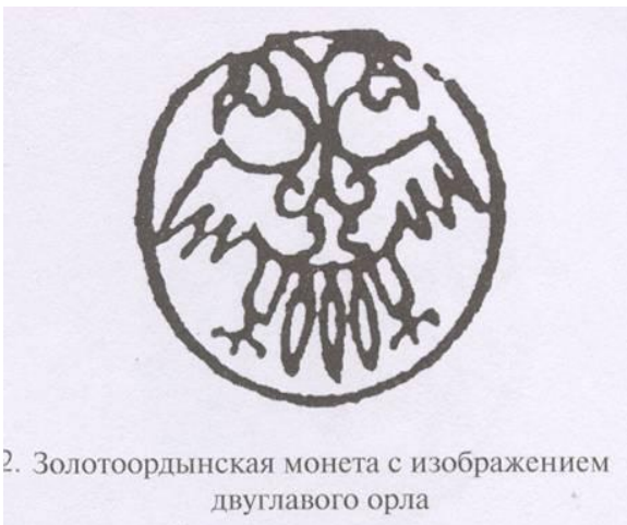
2. Золотоордынская монета с изображением двуглавого орла