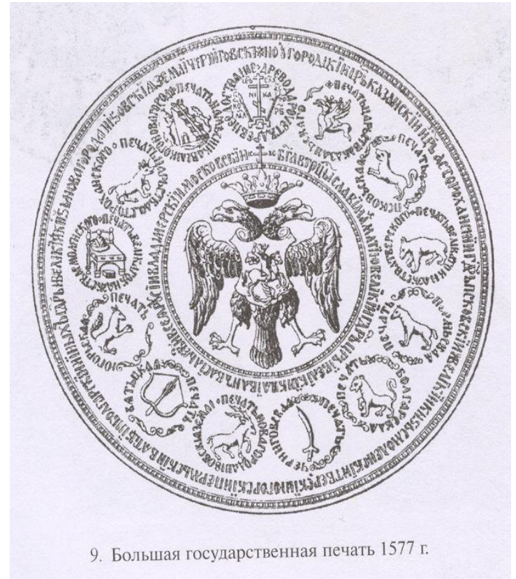
9. Большая государственная печать 1577 г.