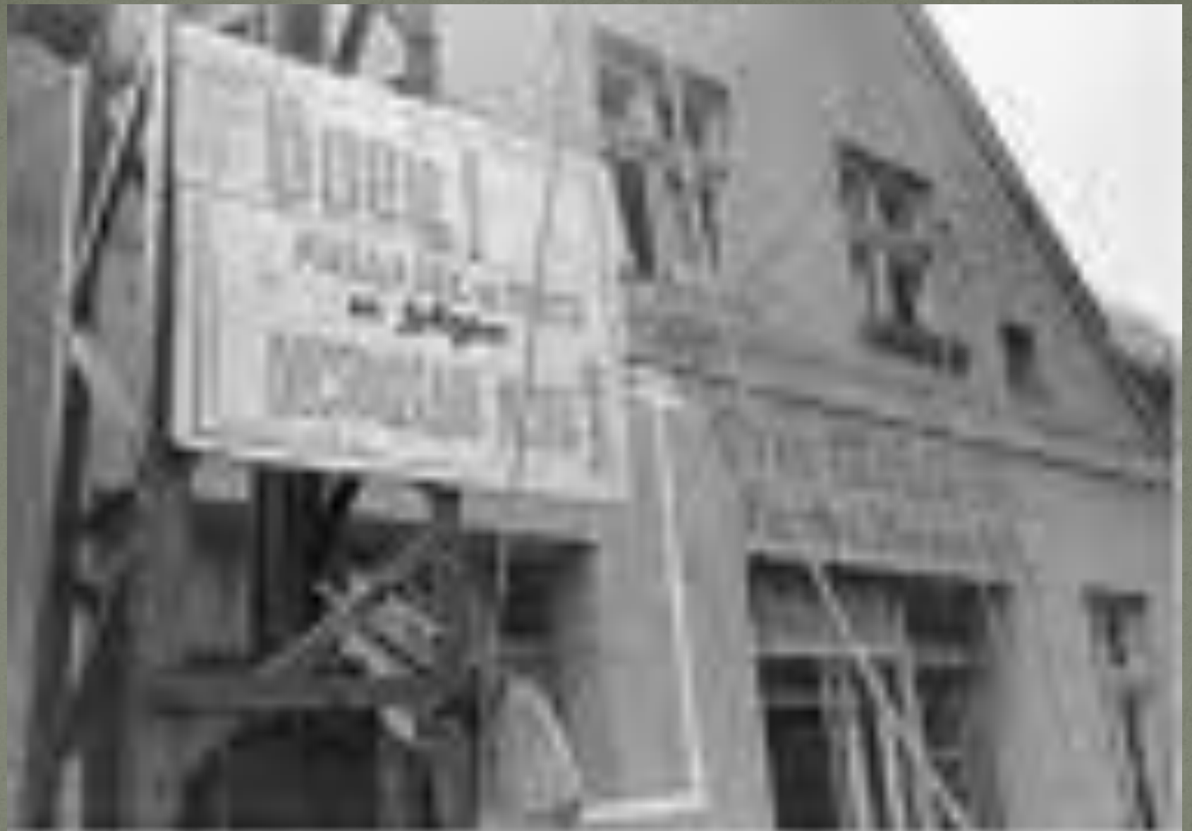
RENOVATION OF THE BUILDING