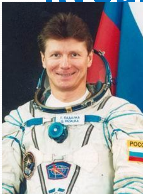
Геннадий Иванович Падалка