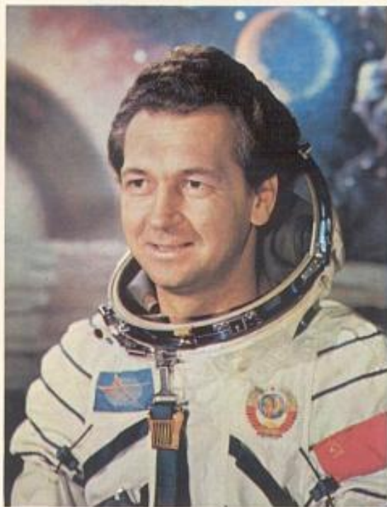
Дважды Герой Советского Союза, лётчик-космонавт СССР Виталий Иванович СЕВАСТЬЯНОВ