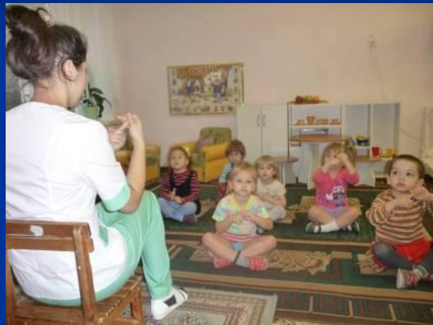
Каждый пальчик покручу ...