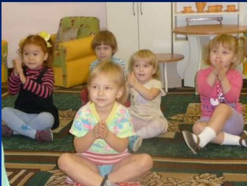
Разотру ладошки сильно ...