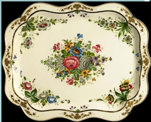
роспись с углов