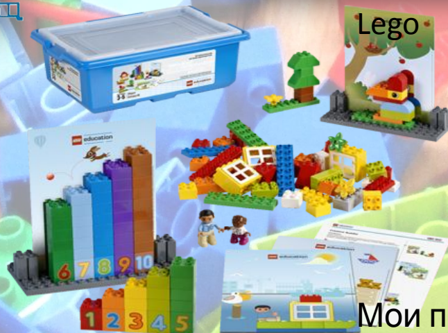
Мои первые конструкции