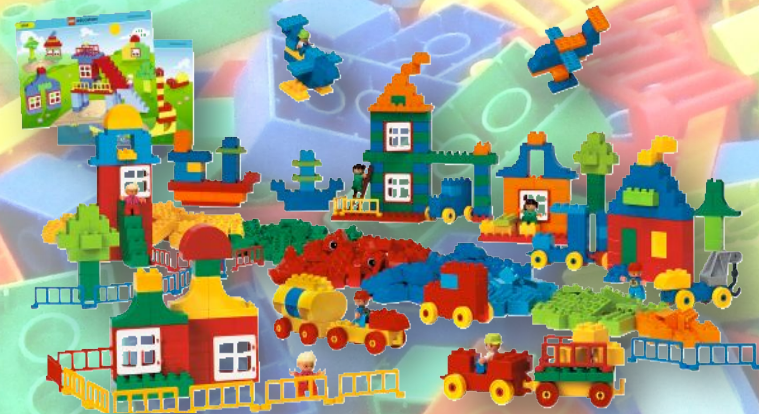
Гигантский набор LEGO DUPLO

Конструкторы LEGO подразделяются на два вида - для младшей и старшей возрастной группы детей. Для детей младшего возраста предназначены конструкторы с крупными деталями: