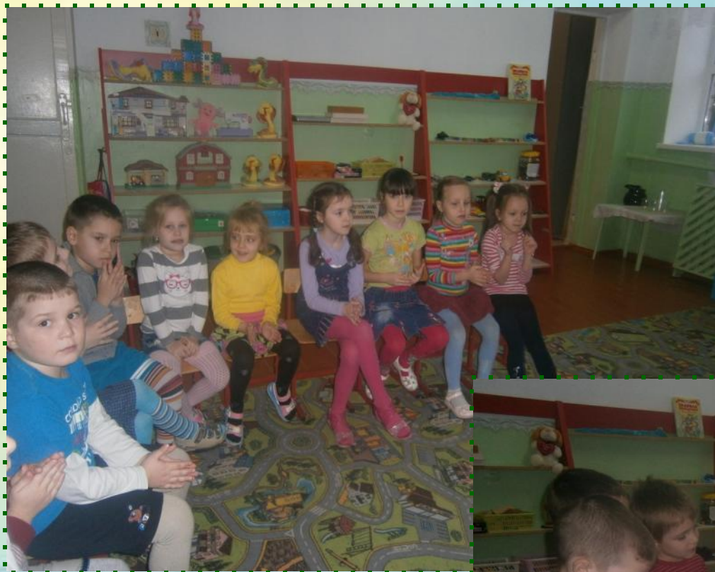
Беседа «Зачем нужен режим».