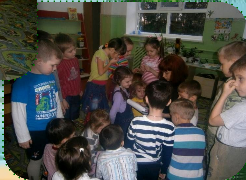
Беседа «Быть здоровыми хотим».