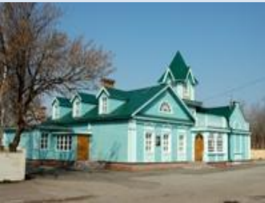
Музей "Симбирская фотография"