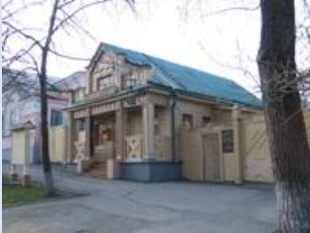
Музей "Мелочная лавка"