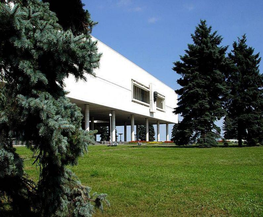
Дом-музей В.И. Ленина