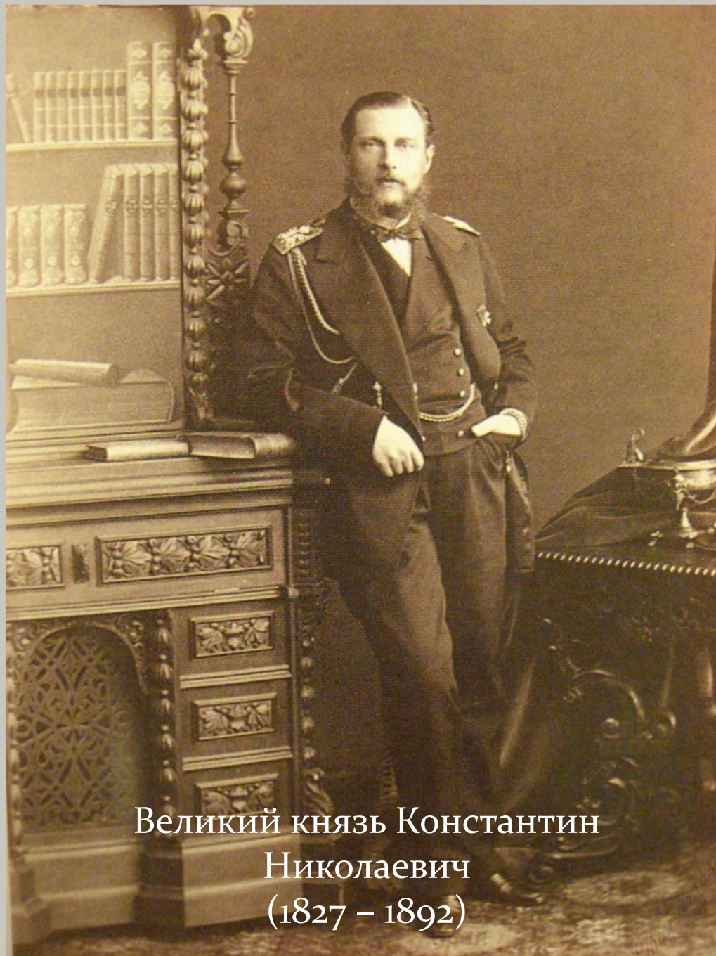
Великий князь Константин Николаевич (1827 – 1892)

В 46 губерниях были учреждены губернские «комитеты об улучшении быта помещичьих крестьян».