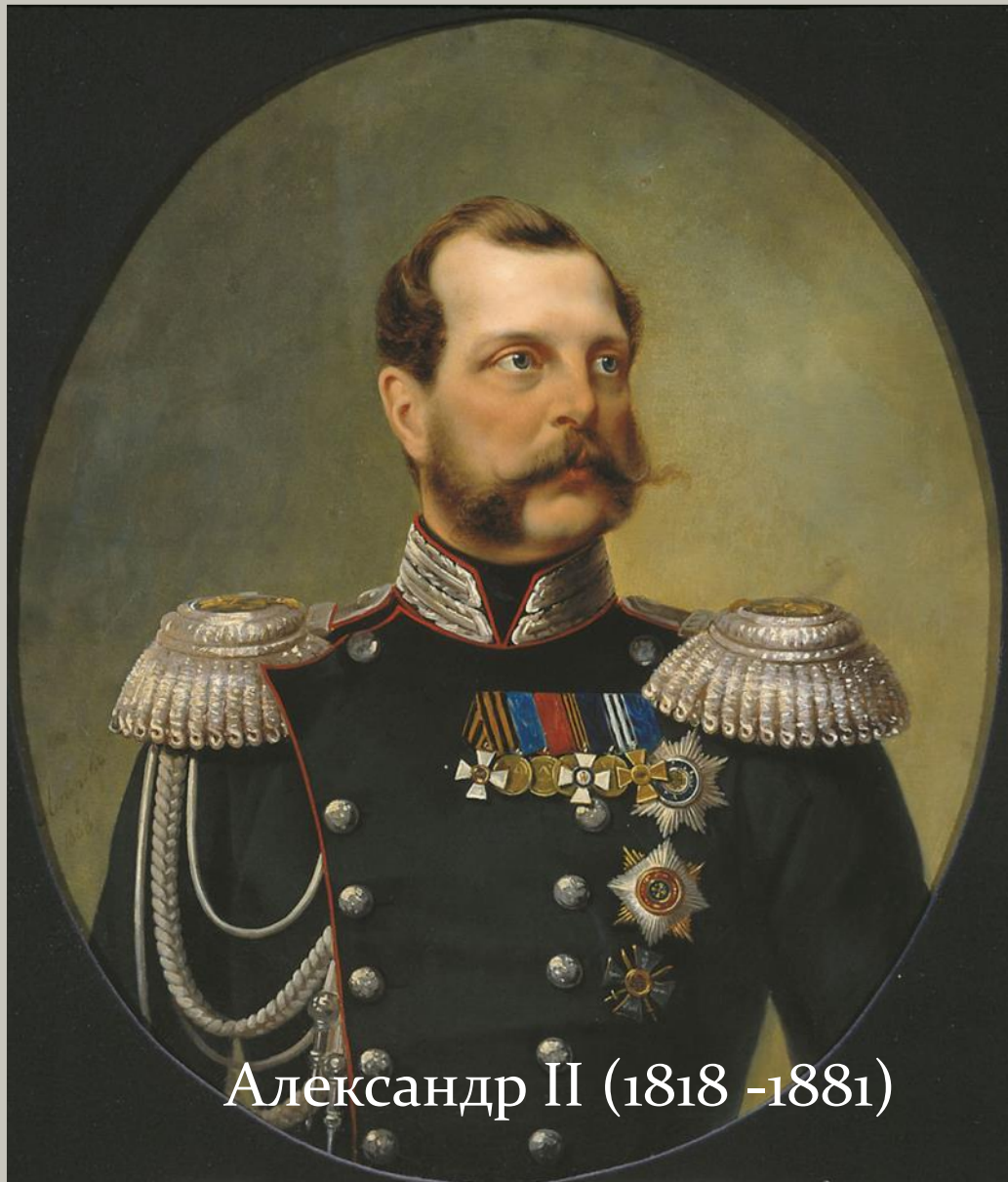
Александр II (1818 -1881)

19 февраля 1855 г. на российский престол вступил новый император – Александр II.