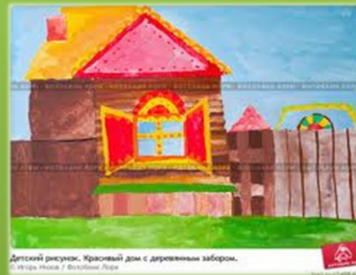
Детский рисунок. Красивый дом с деревянным забором.