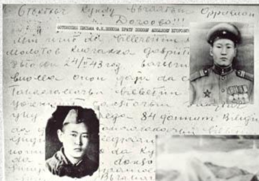
Отрывки письма Ф.К. Попова брату Попову Аполлону Егоровичу