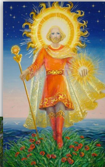
Ярило бог солнца