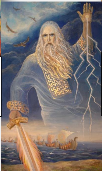
Перун бог грома и молний