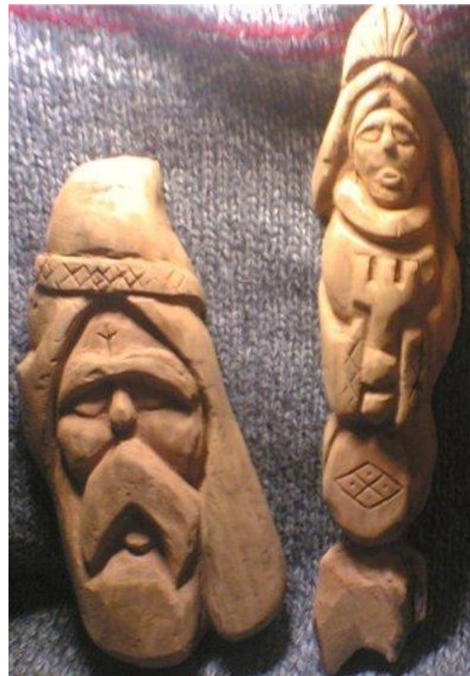
Славянские боги Сварог и Мокошь

Идол – деревянная или каменная статуя, изображение бога