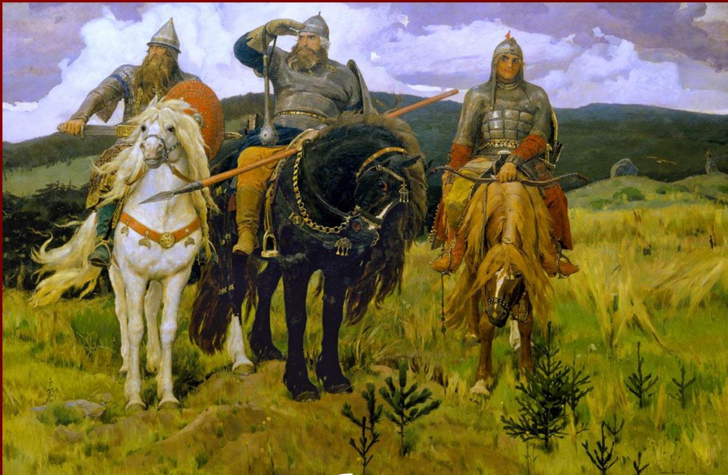
Картина «Три богатыря» Виктор Михайлович Васнецов