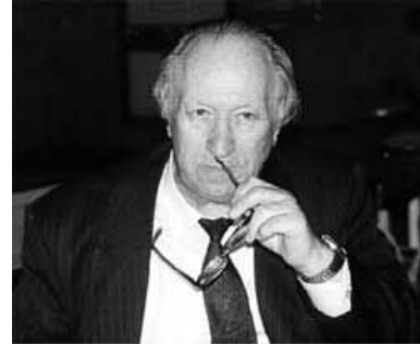
Василий Васильевич Давыдов

Образовательная система Д.Б. Эльконина-В.В. Давыдова имеет уже более чем 40-летнюю историю существования: сначала в виде разработок и экспериментов, а в 1996 году Решением Коллегии Министерства образования РФ образовательная система Эльконина-Давыдова была признана одной из трех государственных систем, наравне с традиционной системой и системой развивающего обучения Л.В.Занкова.