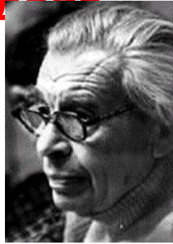
Даниил Борисович Эльконин