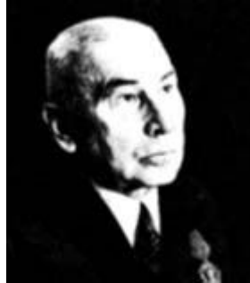
Леонид Владимирович Занков

Принципы: самостоятельность учащегося, творческое постижение материала . Учитель не выдаёт школьникам истины, а заставляет до них «докапываться» самим. Схема обратная традиционной: сначала даются примеры, а учащиеся сами должны сделать теоретические выводы . Усвоенный материал также закрепляется практическими заданиями. Новые дидактические принципы этой системы — это быстрое освоение материала, высокий уровень трудности, ведущая роль теоретических знаний. Постижение понятий должно происходить в понимании системных взаимосвязей.