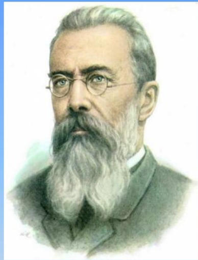
Николай Андреевич Римский-Корсаков (1844-1908)