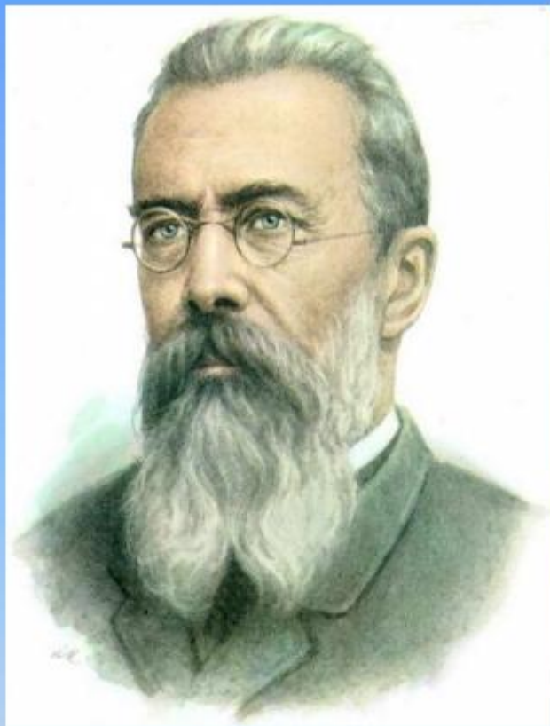
Николай Андреевич Римский-Корсаков (1844-1908)