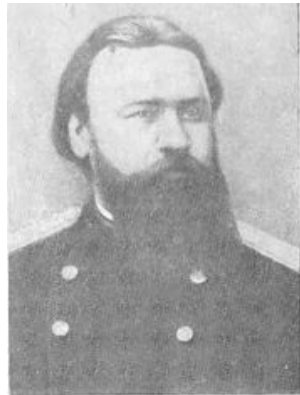
А. П. Доброславин (1842—1889).