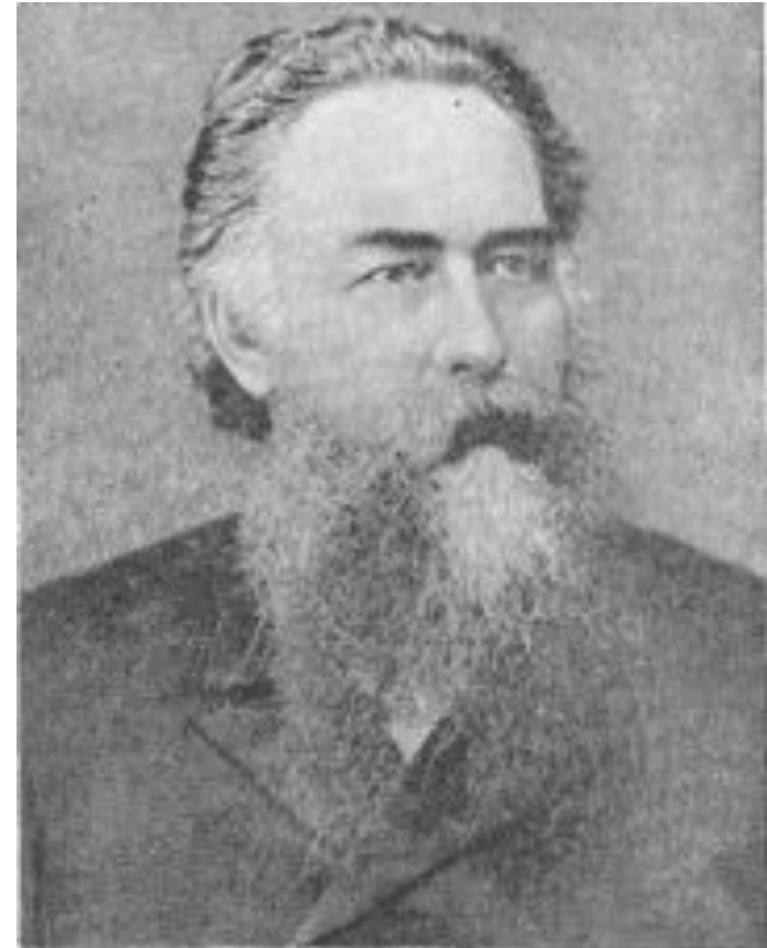
Ф. Ф. Эрисман (1842—1915).