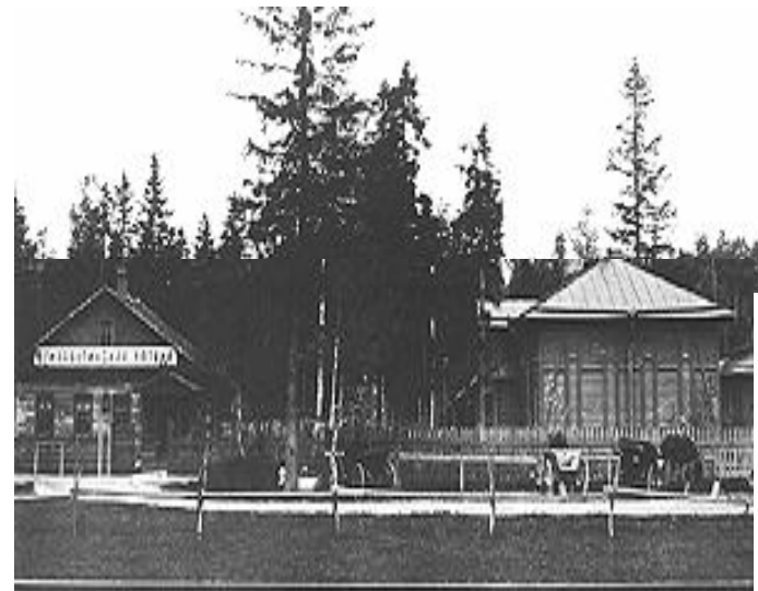
Земские больница и аптека. Фото начала XX века.