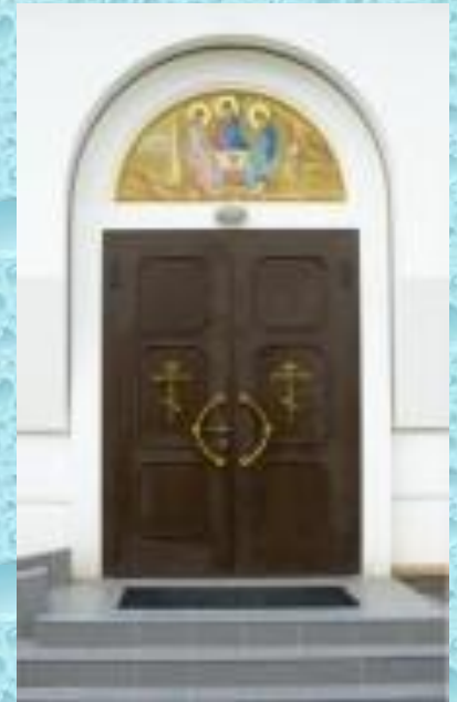
Великие двери храма.