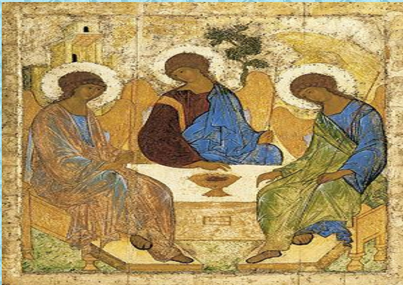
Андрей Рублёв «Троица», 1411год или 1425 – 27 Государственная Третьяковская галерея, Москва.