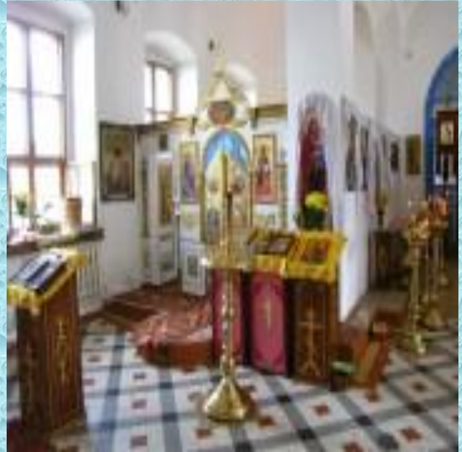
Введенская церковь в Кашире. Иконостас левого Космодамианского придела.