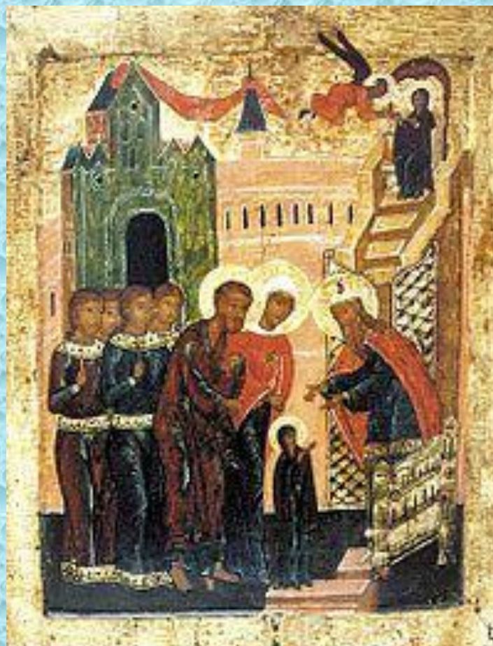
Введение во храм Пресвятой Богородицы (икона, XVI век)