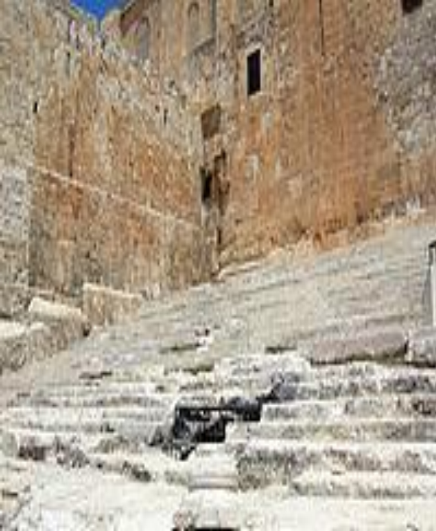
Древняя лестница, по которой молящиеся поднимались на Храмовую гору.