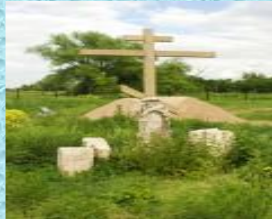
Сохранившиеся надгробия от старого кладбища и поминальный крест