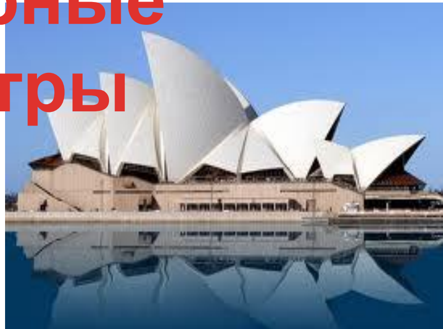
Оперный театр в Сиднее. Австралия.