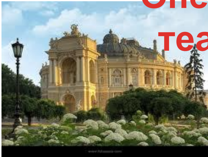
Одесский театр оперы и балета