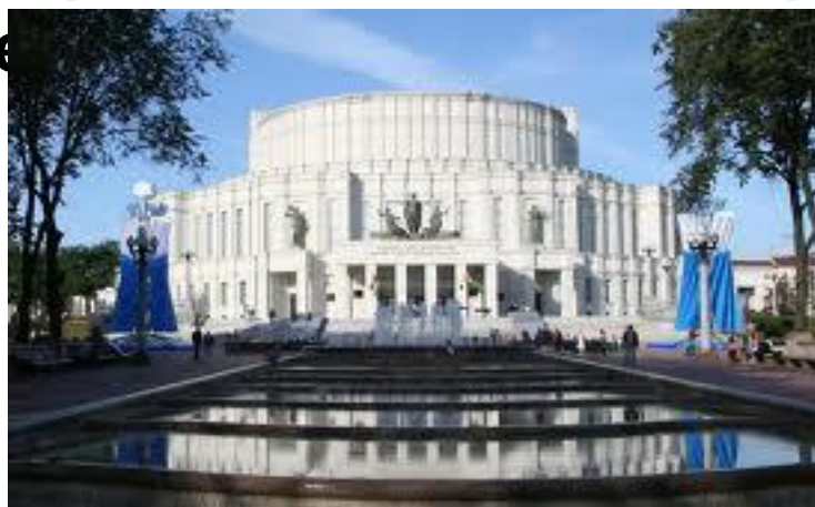
Минский театр оперы и балета