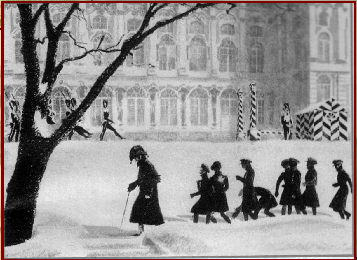
Лицейсты на прогулке