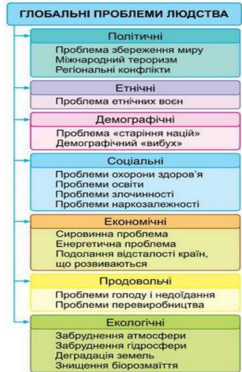
Мал. 186. Глобальні проблеми людства