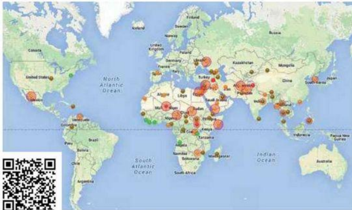
Мал. 187. Карта конфліктів, що тривають у світі (оновлюється за аналізом англomовних ЗМІ; http://googlemapsmania.blogspot.com/2017/04/mapping-world-at-war.html )