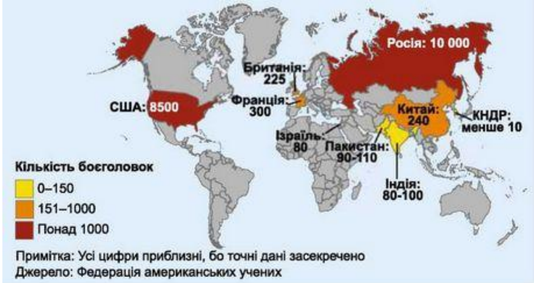
Мал. 113. Запаси ядерної зброї в деяких країнах світу

Приблизно 30 країн входять до групи так званих латентних ядерних держав, що не мають ядерної зброї, але здатні її створити ( Аргентина, Бразилія, Канада, Німеччина, Швеція, Швейцарія, Республіка Корея, Японія та ін. )