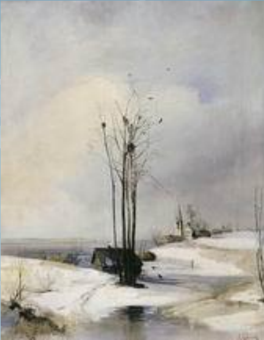
Ранняя весна. Оттепель. 1880-е гг.

То мороз, То лужи голубые, То метель, То солнечные дни. На пригорках Пятна снеговые Прячутся от солнышка В тени. Над землёй- Гусиная цепочка, На земле — Проснулся ручеёк, И зиме показывает Почка Озорной, зелёный Язычок.