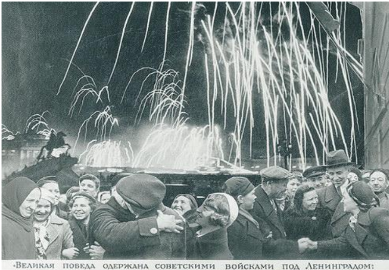
-Великая победа одержана советскими войсками под Ленинградом:

Памятник-ансамбль «Разорванное кольцо» Здесь начиналась «Дорога жизни»