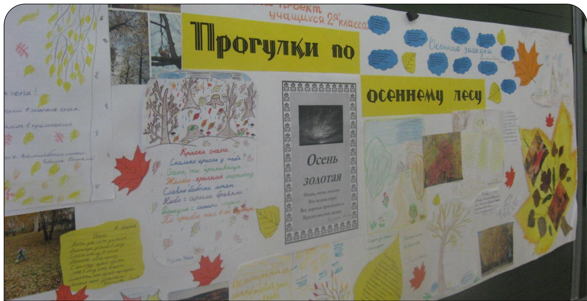
Коллективный творческий проект учащихся 2 «А» класса. Газета, созданная на обобщающем уроке литературного чтения по теме «Краски осени»