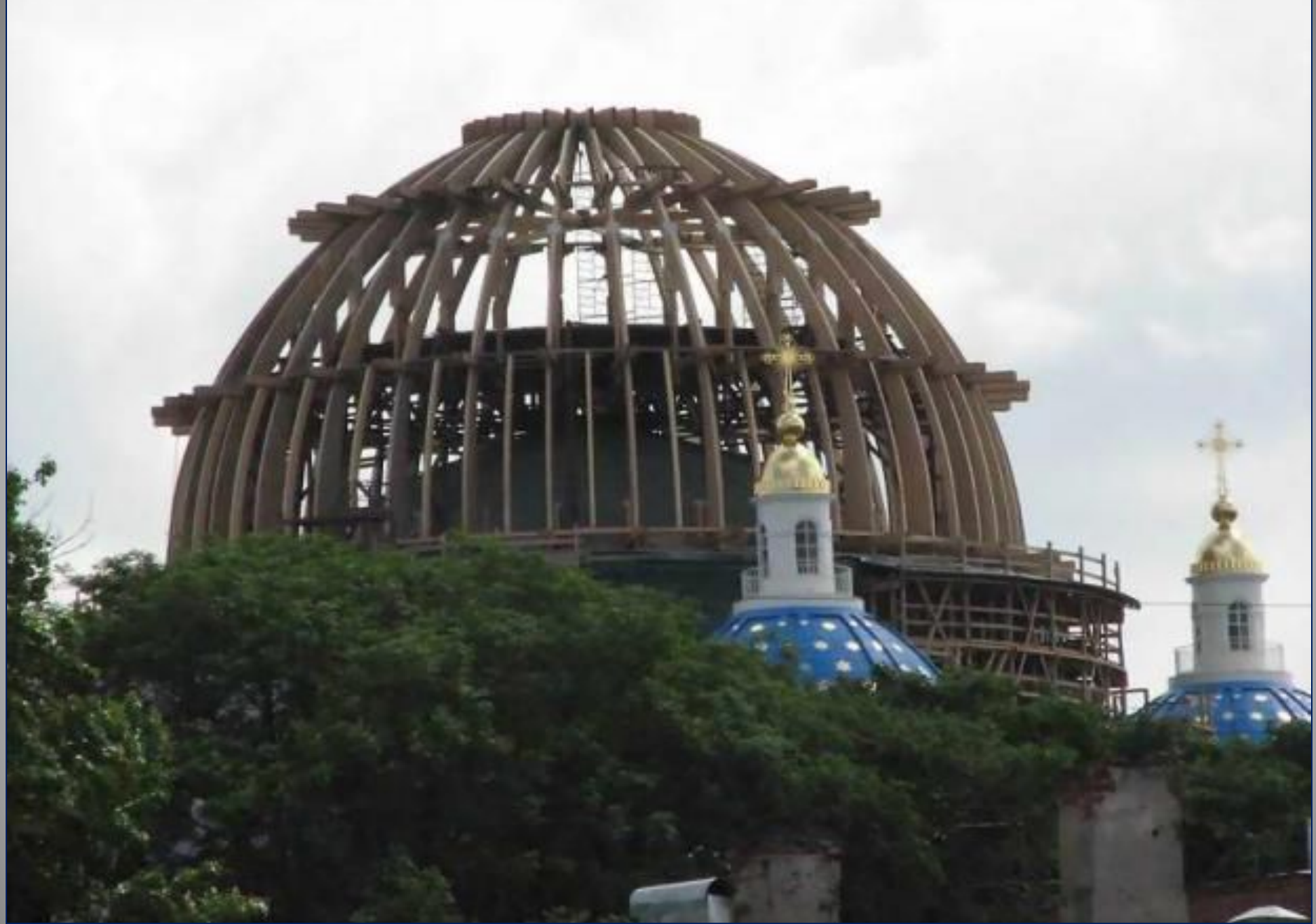
The main dome was restored