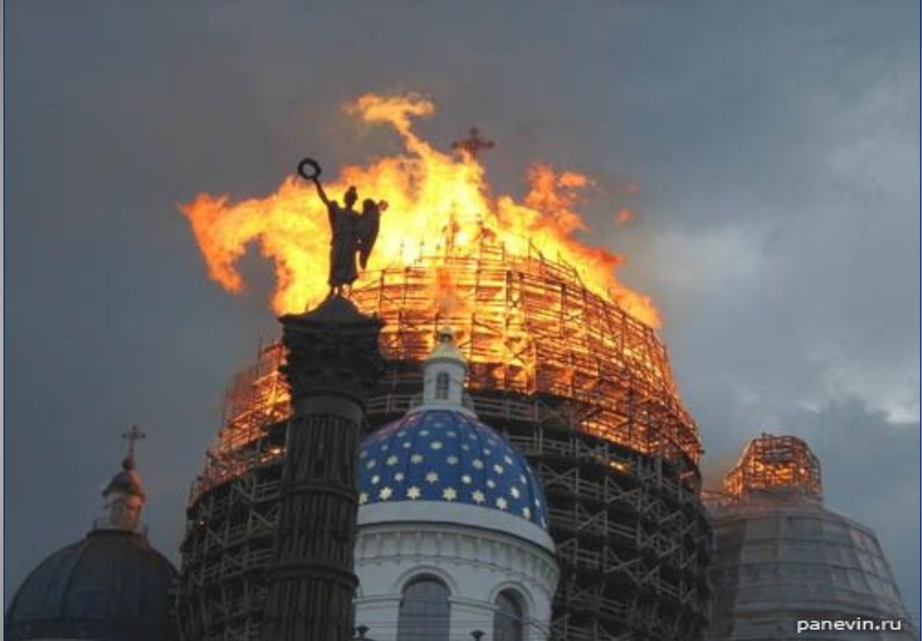
The fire destroyed the main dome on the 25 th of August 2006.