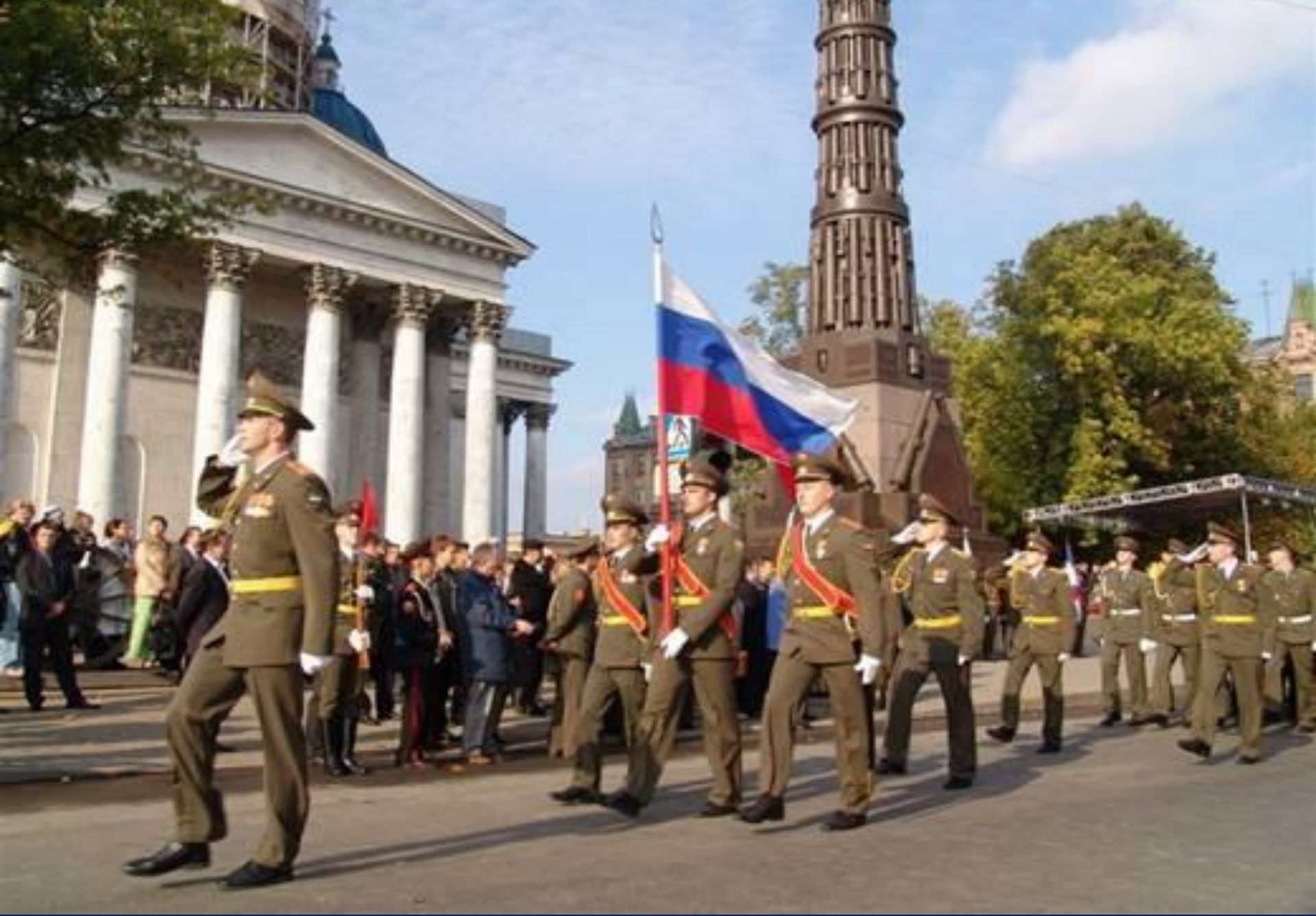
The Column of Glory was dismantled in 1930 . It was restored in 2005.