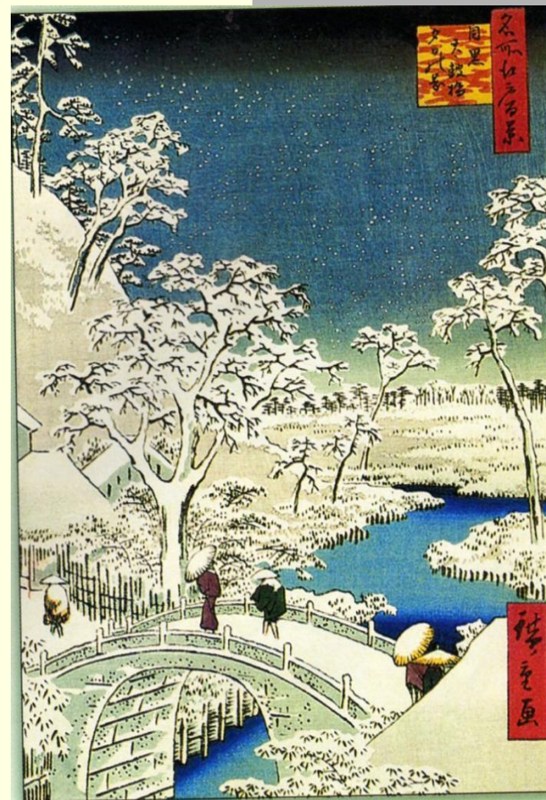
Андо Хиросигэ. Мост Тайкобаси и холм Юхиноока в Мэгуро. 1857