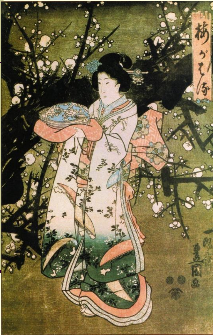
Тоёкуни. Красавица и зимнее цветение сливы