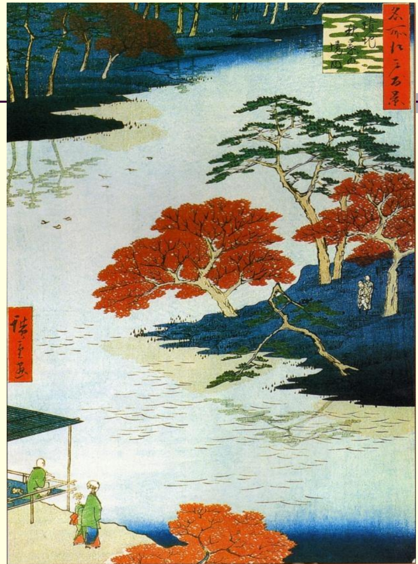
Андо Хиросигэ. На территории святилища Акиба в Укэдзи. Из серии «Осень»

Поминание Ториномэти в полях Асакуса. 1857