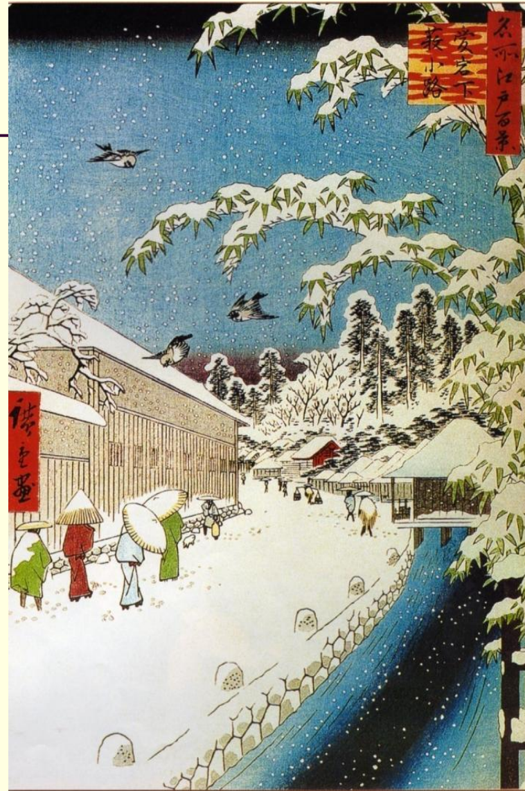
Андо Хиросигэ. Улочка Ябукодзи в Атагосита. Из серии «Зима»