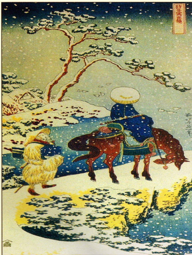
Кацусика Хокусай. Поэт Тоба в изгнании. Из серии «Поэты Китая и Японии». Около 1830 г.