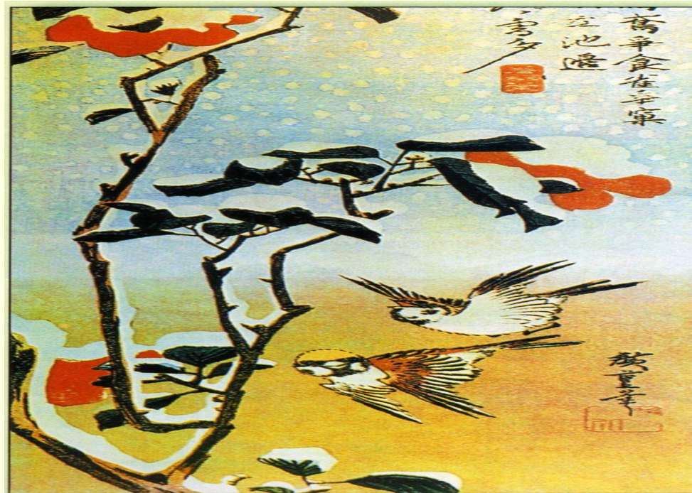
Андо Хиросигэ. Ласточки и камелии под снегом

Красота, изысканность созданных образов, возможность дорисовать картину самим слушателям.