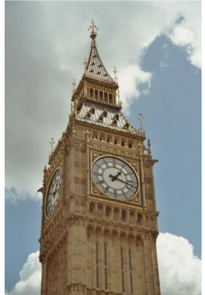
Биг Бен г. Лондон Великобритания