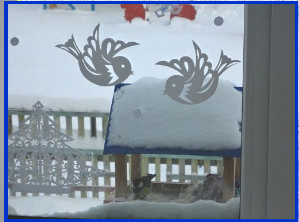
Творчество семьи Марии Мальцевой.