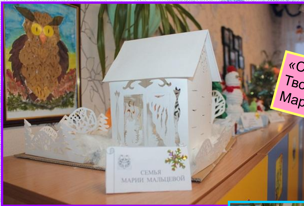
«Снежный дворец» Творчество семьи Марии Мальцевой.