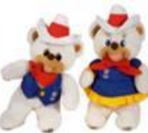
1988, Калгари: белые медвежата Хайди и Хоуди.