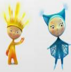
2014, Паралимпийские игры: Лучик и Снежинка