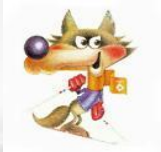
1984, Сараево: волчонок Вучко