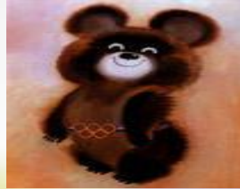
1980, Москва: медвежонок Миша