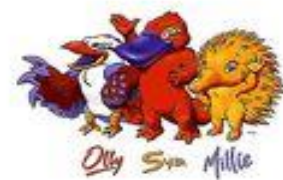
2000, Сидней: кукабарра Олли, утконос Сид, ехидна Милли

Паралимпийские игры также имеют свои талисманы