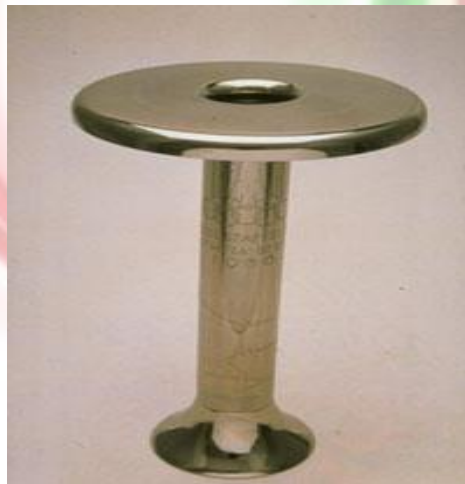
первый олимпийский факел. Берлин 1936

Штаб-квартира МОК находится в швейцарской Лозанне. Там же расположен Олимпийский музей, открытый в 1993 году. Его экспозиция насчитывает более 10 тысяч экспонатов (среди них есть защитный шлем барона де Кубертена, заядлого фехтовальщика, и первый олимпийский факел).