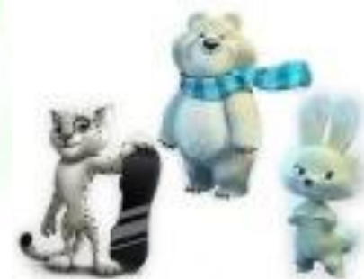
2014, Сочи: Леопард, Белый мишка и Зайка