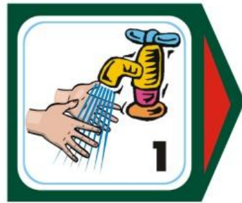
Схема мытья рук разрезная