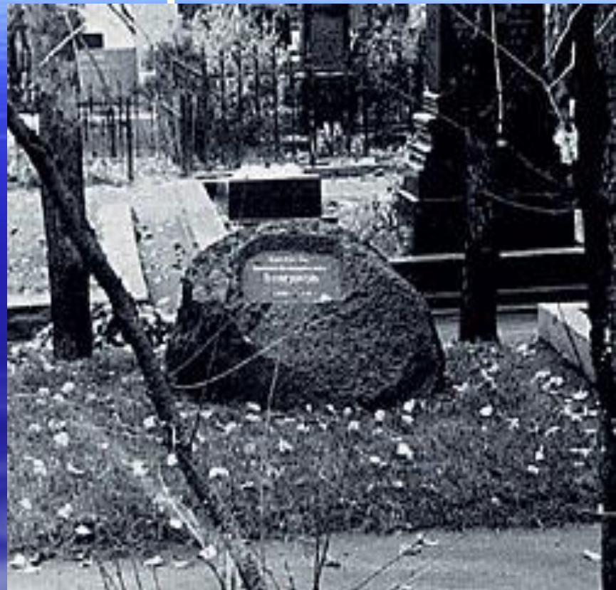
Могила М. Булгакова.