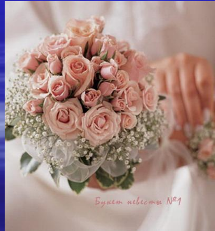
Букет невесты №1

Булгаков надел на венчание Тасин золотой браслет — он почему-то был уверен, что эта безделушка приносит счастье.