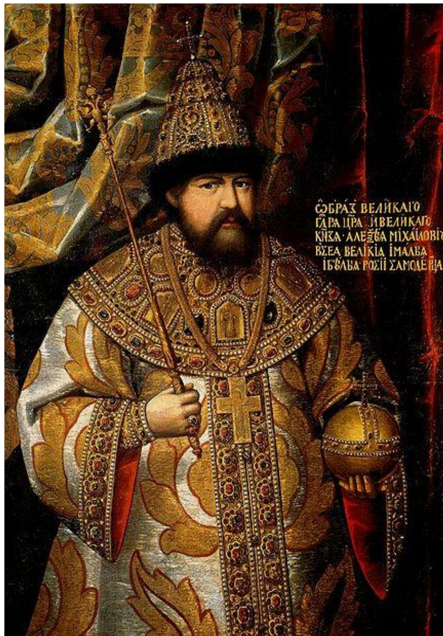
СЪБРАЗЪ ВЕЛИКАГО ЦАРЯ И ВЕЛИКАГО КНЯЗЯ АЛЕКСѢЯ МИХАЙЛОВИЧА ВСЕА ВЕЛИКІА ІМАЛІА І БѢЛАЯ РОСІИ ЗАМОУЩЕВІА.