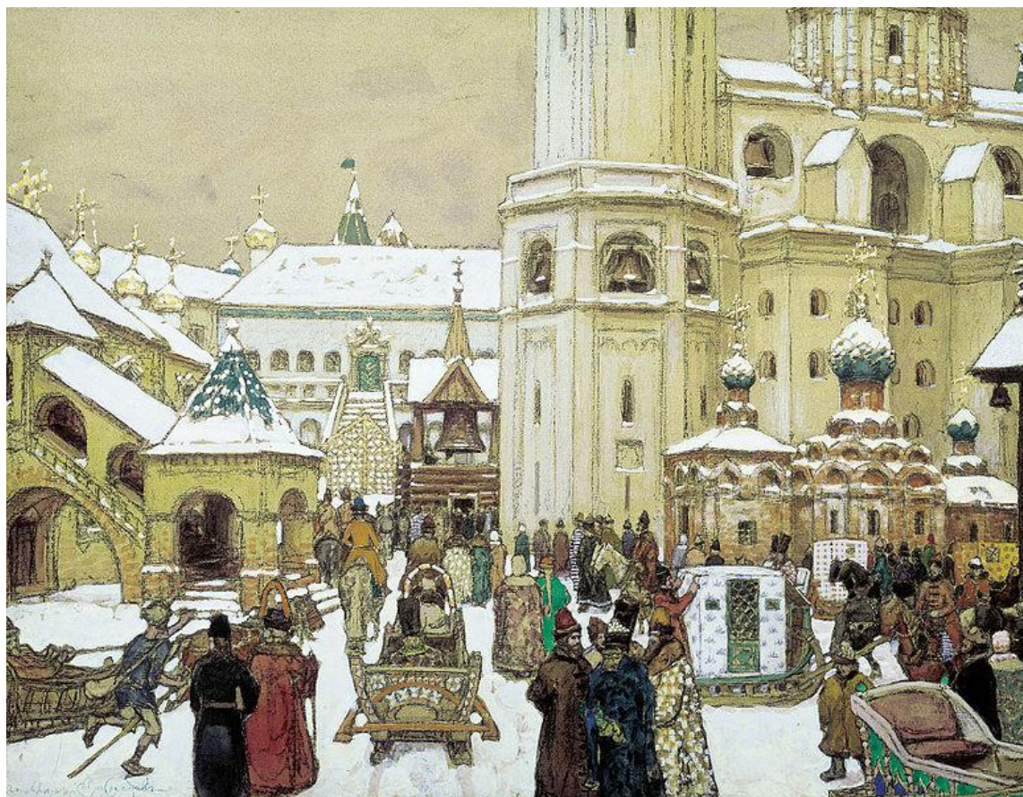
А. Васнецов «Площадь Ивана Великого в Кремле»

Ивановская площадь — площадь в московском Кремле, одна из древнейших площадей Москвы.