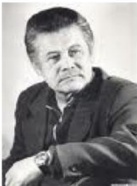
БЕРДІБЕК СОҚПАҚБАЕВ 1924-1992 жылы