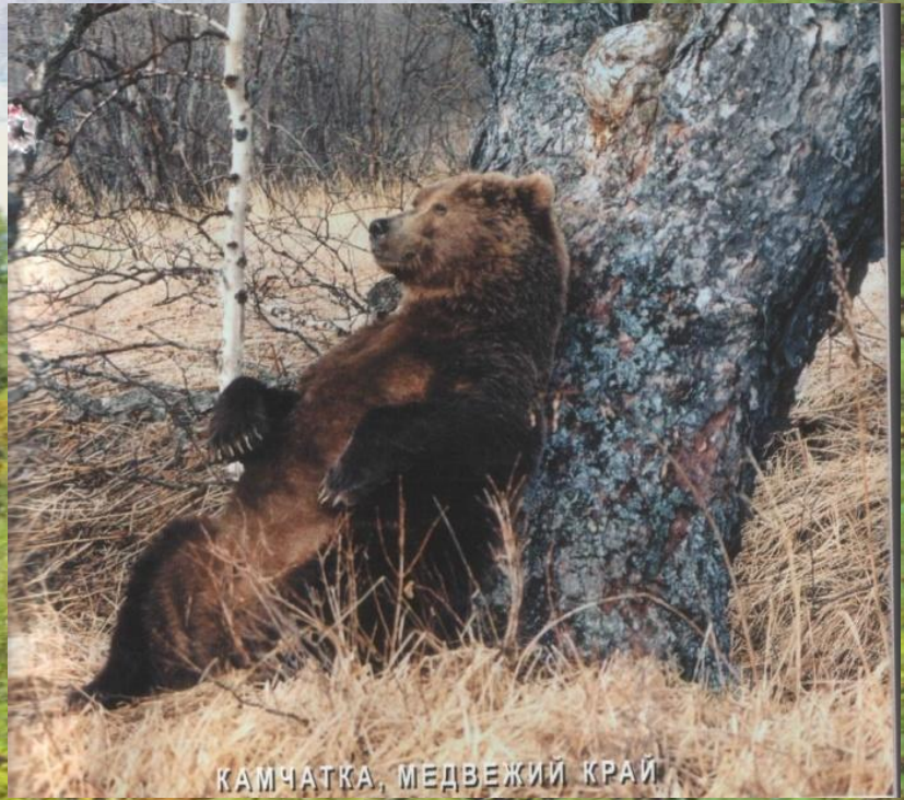
КАМЧАТКА, МЕДВЕЖИЙ КРАЙ