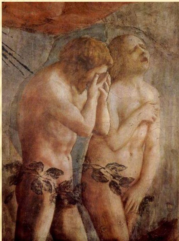
«ИЗГНАНИЕ АДАМА И ЕВЫ ИЗ РАЯ»