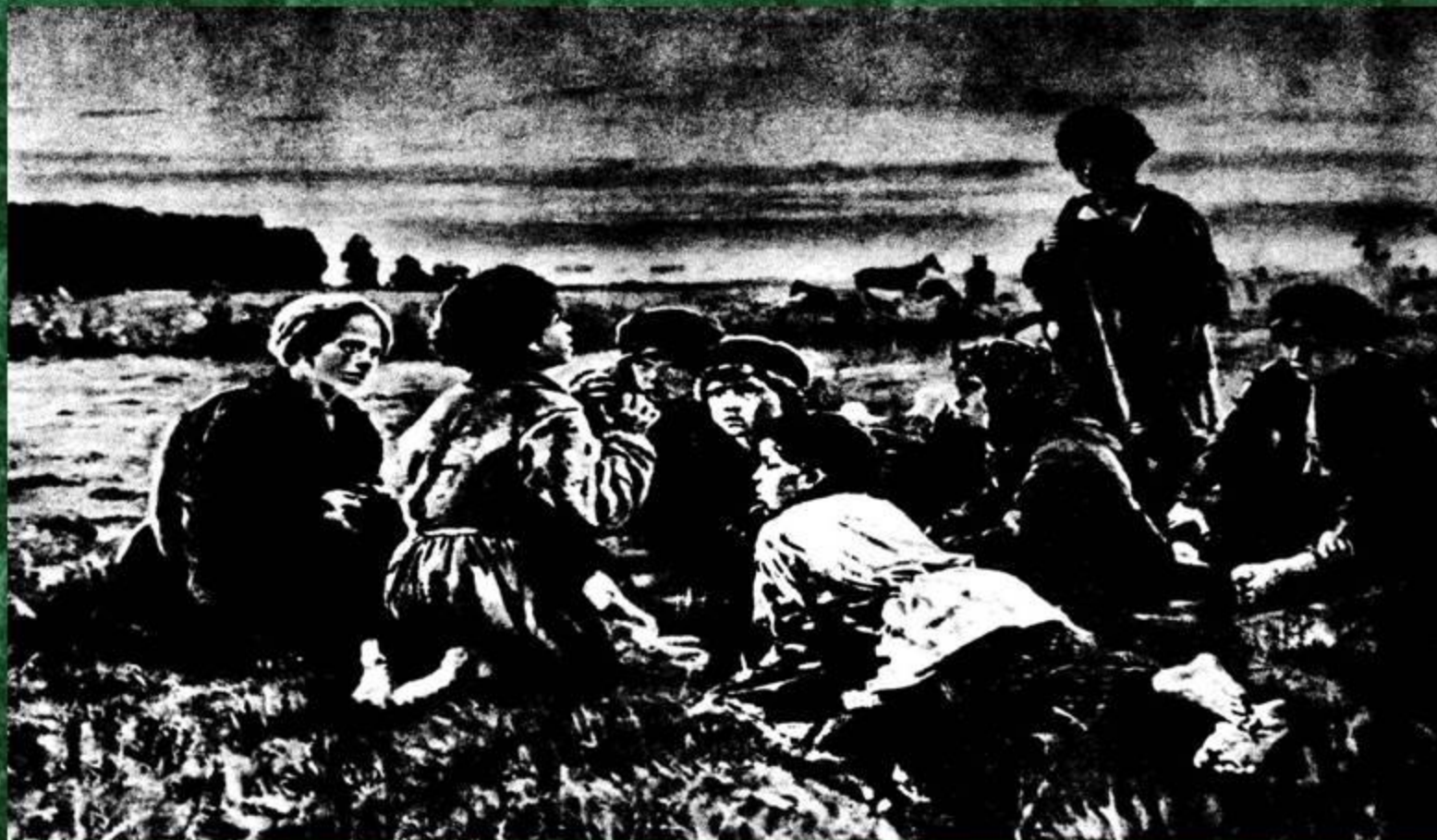
Ночное. В.А.Маковский. 1879