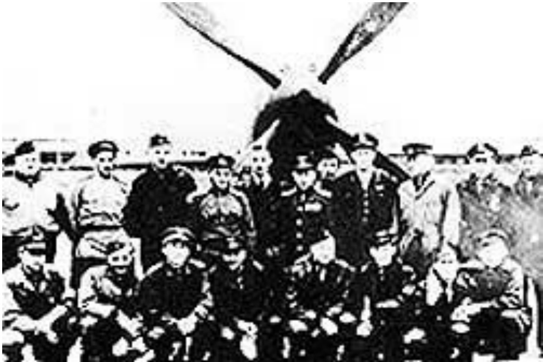
ПЕРВЫЙ ПЕРЕГОНОЧНЫЙ АВИАПОЛК